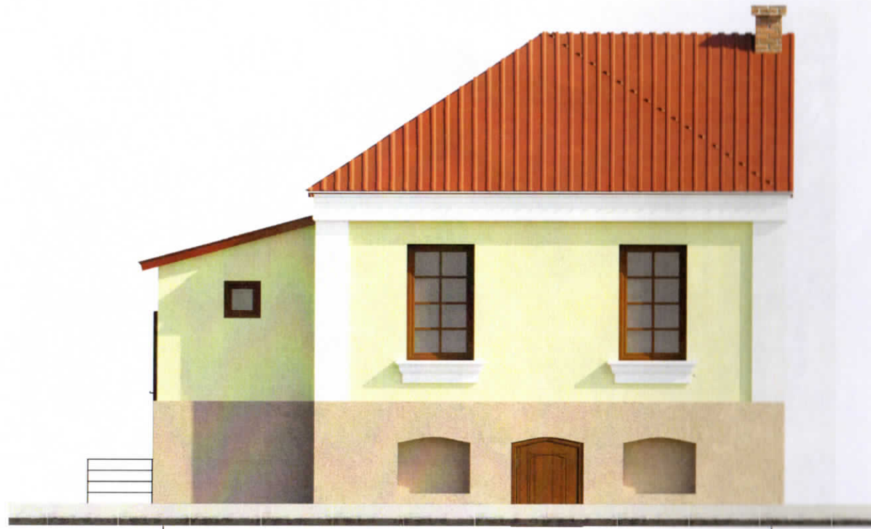
Фасад в осях 1-3