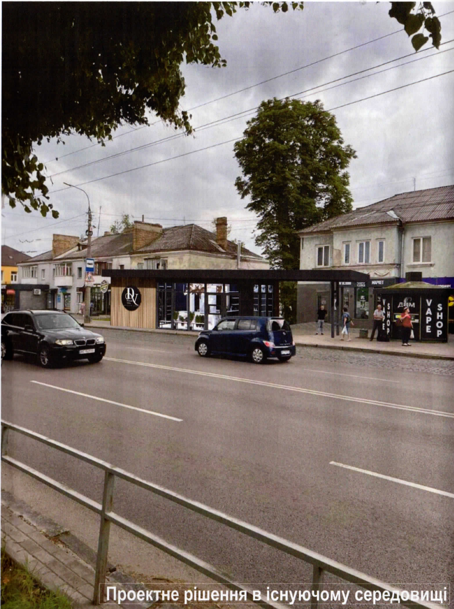
Проектне рішення в існуючому середовищі

Відсутній монтаж нагнано до проекту DEPARTAMENT MISTOBUDUVANНЯ, ZEMELNYKH RESURCIV TA REKLAMI LUCЬKOЇ MISCЬKOЇ RADI ПРОПОЗИЦІЯ ПОГОДЖЕНА ДАТА: 11.07.24 РОСЛІСНИЙ АРХІТЕКТ: М. В. В.