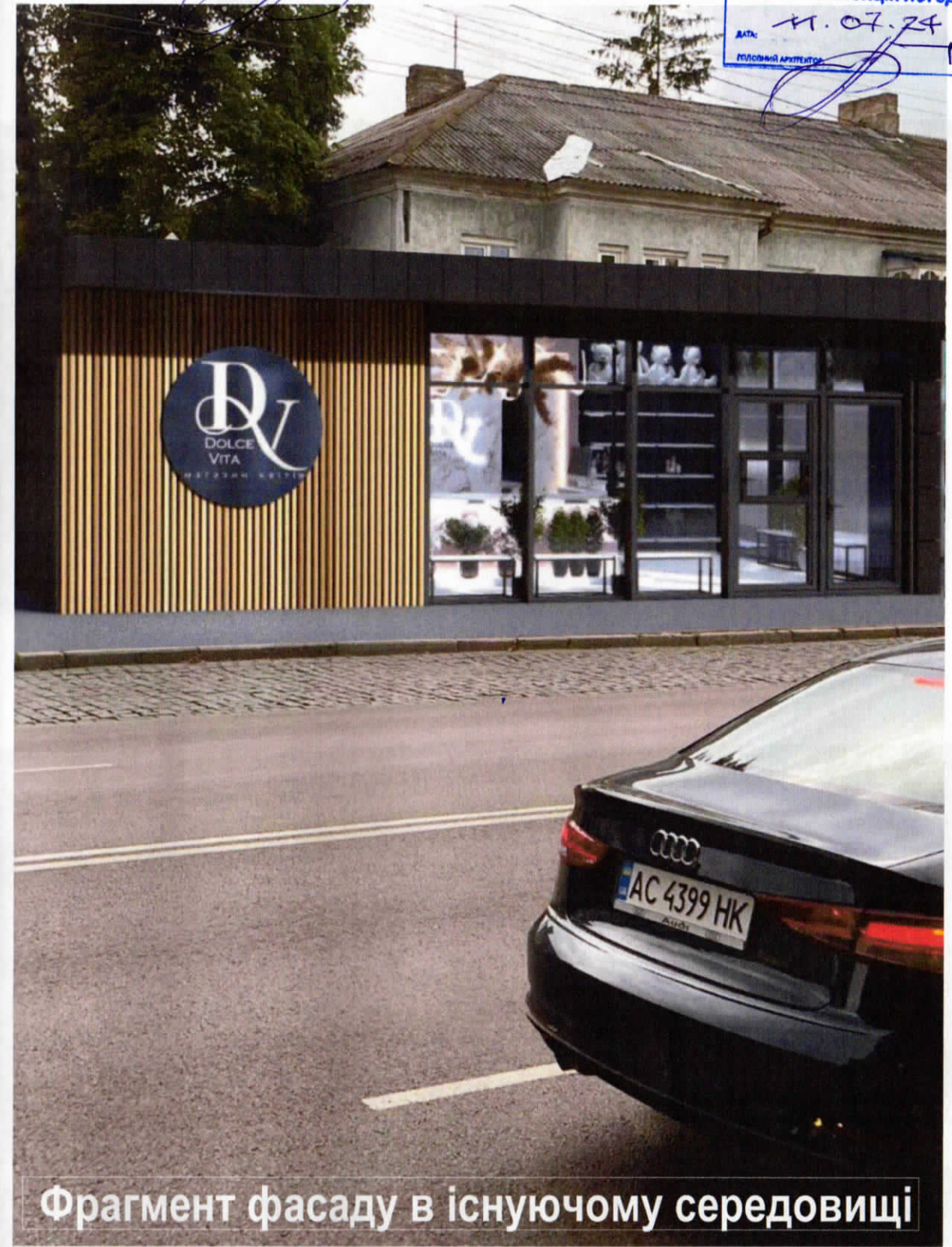
Фрагмент фасаду в існуючому середовищі